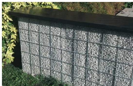
Kit Gabion déco avec gabion métallique Chaperon ardoisé brossé