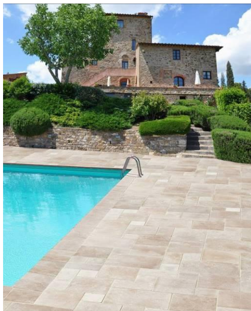
Dallage opus et margelle beige Calcaire Pharaon

Les margelles complètent l'aménagement des plages de piscine avec des déclinaisons calcaire Indian, calcaire Pharaon, calcaire Pierre bleue ainsi que travertin.