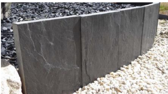
Graviers blancs purs concassés 9/12 Paillage ardoise noire 10/50

La gamme de graviers s'étoffe d'une variation de teintes dont six nouveautés, allant du quartz blanc au marbre rose, en passant par le camaïeu. Côté galets, le choix des couleurs se multiplie également avec l'ajout du gris nuancé, du calcaire crème et d'un mélange multicolore.