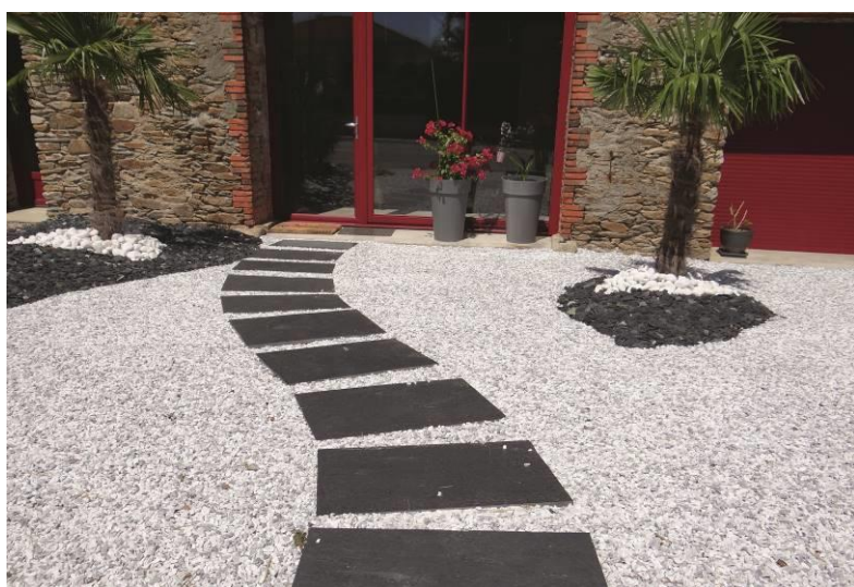
Marche margelle en ardoise