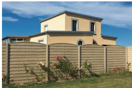
Clôture décorative Natura

Le gabion reste tendance ! Il est aujourd'hui disponible sous forme de kit Gabion Déco incluant le gabion, les graviers et la finition ardoise brossée en chaperon.